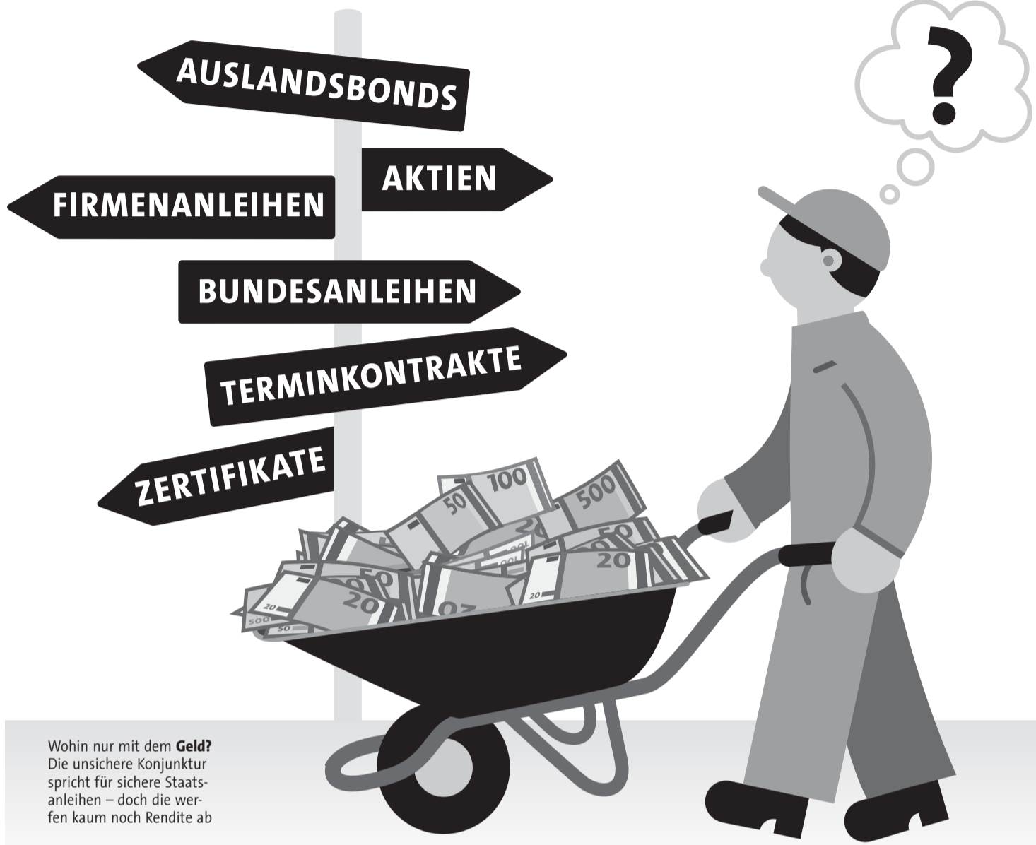
Wohin nur mit dem Geld? Die unsichere Konjunktur spricht für sichere Staatsanleihen – doch die werfen kaum noch Rendite ab

Zumindest denkbar ist das, zeigt das Beispiel Japan, wo eine hartnäckige Deflation herrscht. Zehnjährige Staatsanleihen werfen dort nur noch rund ein Prozent ab. Würde die Rendite der Bundesanleihen auf dieses Niveau fallen, wäre noch ein Kursgewinn von rund zehn Prozent möglich, rechnet Steinemann vor.